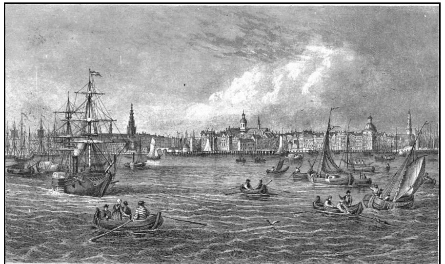
Zo zag Swedenborg Amsterdam, als hij per schip arriveerde over het IJ.